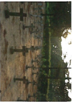
Begraafplaats Merksplas Kolonie